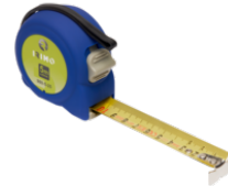
Cinta métrica, 3 m x 16 mm 980-3-1